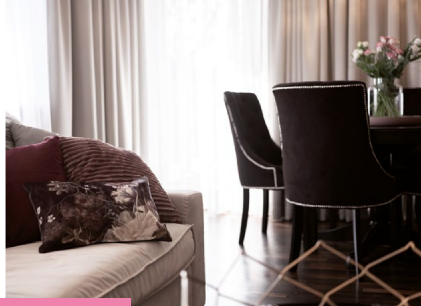
Projekt: arch. Karolina Drogoszcz, Pracownia Mango Studio (Kraków)