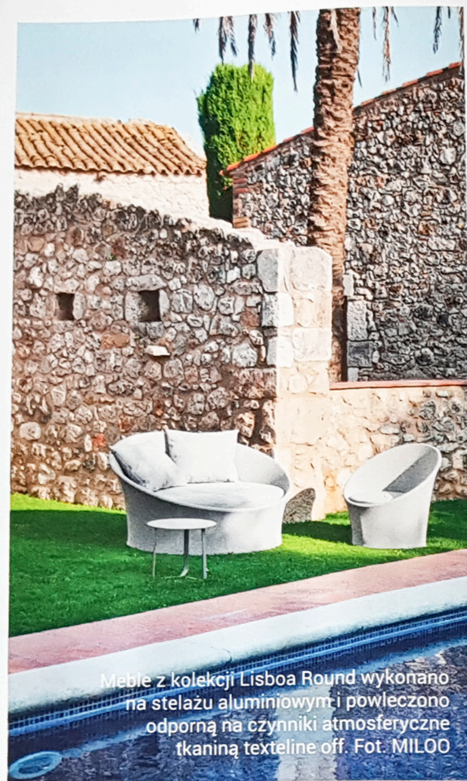
Mebel z kolekcji Lisboa Round wykonano na stelażu aluminiowym i powleczono odporną na czynniki atmosferyczne tkaniną texteline off.