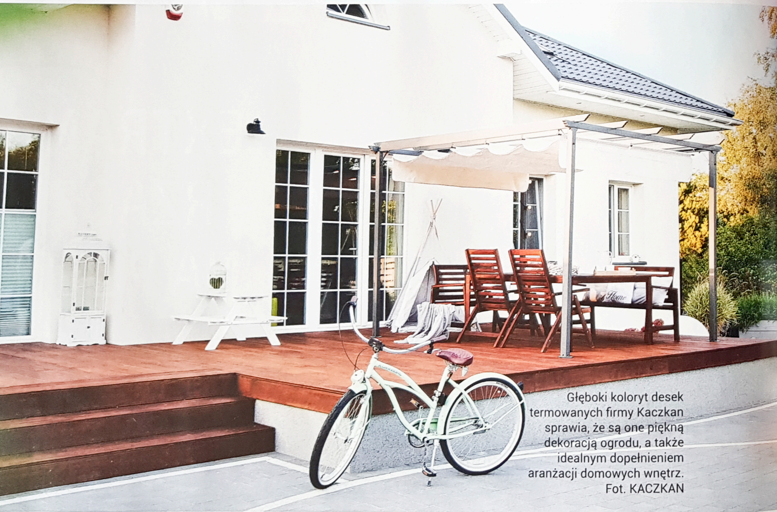
Głęboki koloryt desek termowanych firmy Kaczkan sprawia, że są one piękną dekoracją ogrodu, a także idealnym dopełnieniem aranżacji domowych wnętrz.