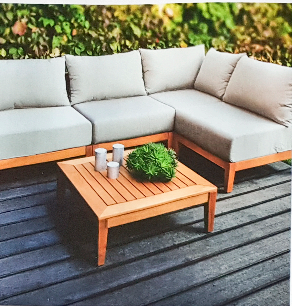
na robinii zapewnia serii mebli Vesper nadzwyczajną trwałość, rodzaj drewna swoimi właściwościami mechanicznymi odpowiada wytrzymałością i twardością dębinie. Z kolei tki obleczone są zdejmowalnymi pokrowcami do wyboru.