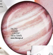
TALERZ „COSMIC - JUPITER”, 158 zł, Seletti, www.9design.pl