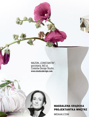
WAZON „CONSTANTIN”, porcelana, 160 zł, Cmielów Design Studio, www.modusdesign.com