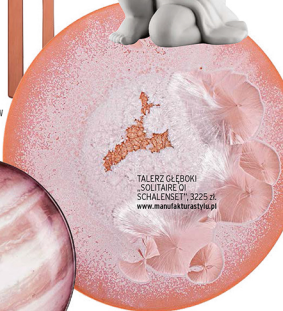
TALERZ GŁĘBOKI „SOLAIRE OI SCHALENSET”, 3225 zł, www.manufakturstyl.pl