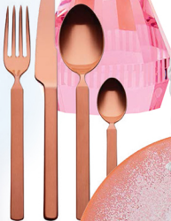
KOMPLET SZTUČCÓW „DRY”, 1790 zł /24 szt., Alessi, www.fabrykaform.pl