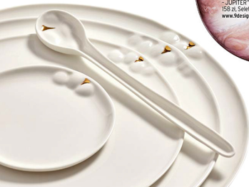
KOMPLET PORCELANY STOŁOWEJ „TAKE TIME”, proj. Kristof i Stefan Boxy, od 26 zł, www.serax.com

Dobłą zasadą przy tworzeniu schematu stołu (zawsze się do niej stosuję) jest rozpoczęcie od jednego motywu - wzoru na porcelanie lub koloru kwiatów, które ustawiam w centralnym punkcie. Modne są pełne odważnej elegancji złote sztuczki i marmurowe dodatki. Zwolennikom stonowanych aranżacji polecam len i kamionkową minimalistyczną zastawę. Ozdoby umieszczam na środku, wzdłuż stołu. Taka mocna wizualnie linia zawsze wygląda świetnie. Kluczem jest ilość - jeśli dekoruję, to z rozmachem. Szklane bombki w głębokim granacie, zieleni mchu lub bursztynie, znalezione na plaży teatralnie zimowe gałęzie. Żywiołowość, chaos czy magia Bożego Narodzenia? Zdecydowanie magia!