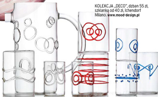
KOLEKCJA „DECO”, dzban 55 zł, szklanka od 40 zł, Ichendorf Milano, www.mood-design.pl